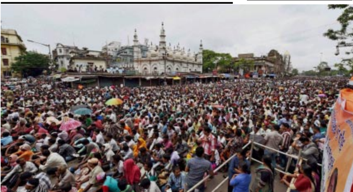
કોલકોતામાં શહીદ દિવસ નિમિત્તે પ.બંગાળના મુખ્યમંત્રીએ યોજેલી શક્તિ રેલીનું દૃશ્ય

હજુ લોકોને યાદ હશે કે કેમ. યેદુરપ્પા ભ્રષ્ટાચારના આરોપોસર ભાજપમાથી દુર કરાયા હતા. અને તેમને મુખ્યમંત્રી તરીકે રાજીનામું આપવું પડ્યું હતું. હવે ભાજપ તેમને મુખ્યમંત્રી બનાવશે.