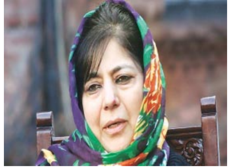
પતિ સાથે તેમણે છુટાછેડા લીધેલા છે.

૨૨મે, ૧૯૫૯ના રોજ જન્મેલા મહેબુબા ની રાજકીય કારકીર્દી ૧૯૯૬થી શરુ થઈ હતી. તેઓ અનંતનાગની લોકસભાની સીટ પરથી પ્રથમવાર ચુંટાઈ આવ્યા હતા. ૧૯૯૯માં તેઓ પીડીપીની રચના બાદ પાર્ટીના ઉપ પ્રમુખ બન્યા હતા. તેમને બે દીકરીઓ છે અને તેમના