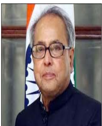
સમયમાં પોતાને ઉચ્ચ મુલ્યો, લેખિત અને અલિખિત સંસ્કારો, કર્તવ્યો તેમજ જીવનશૈલીની યાદ અપાવવા સિવાય બીજો કોઈ માર્ગ ન હોઈ શકે, જે ભારતનો આત્મા છે.

ઈન્ડોલોજી અંગેના પ્રથમ આંતરરાષ્ટ્રીય સંમેલનનું ઉદ્ઘાટન કરતી વેળાએ રાષ્ટ્રપતિએ આપેલ પ્રવચનમાં તેમણે ફરી એક વાર દેશમાં સહિષ્ણુતા અંગેનો સંદેશ પાઠવ્યો હતો. સ્વામી વિવેકાનંદના વિચારોને દુનિયા સમક્ષ રાખતાં મુકરજીએ કહ્યું હતું કે દુનિયા હજુ ભારત પાસેથી ફક્ત સહિષ્ણુતાના જ નહીં પરંતુ સંવેદનાના પાઠ પણ શીખવાના છે. જેના માટે ભારત ઓળખાય છે. તેમણે કહ્યું હતું કે દુનિયા હજુ અસહિષ્ણુતાના બદતર આઘાતમાંથી ઉગરવા માટે સંઘર્ષ કરી રહી છે. ત્યારે ભારતના વિવિધતામાં એકતા જેવા મુલ્યોને બળપ્રદાન કરવાનો અને સમગ્ર દુનિયામાં તેના પ્રચાર-પ્રસારનો સમય છે. આવા