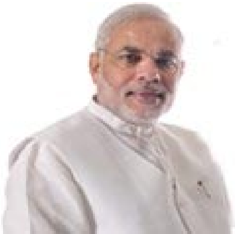
નરેન્દ્ર મોદી, મુખ્યમંત્રી, ગુજરાત રાજ્ય

૬૪મું પ્રજાસત્તાક પર્વ દંડકારણ્ય પ્રદેશ ડાંગમાં