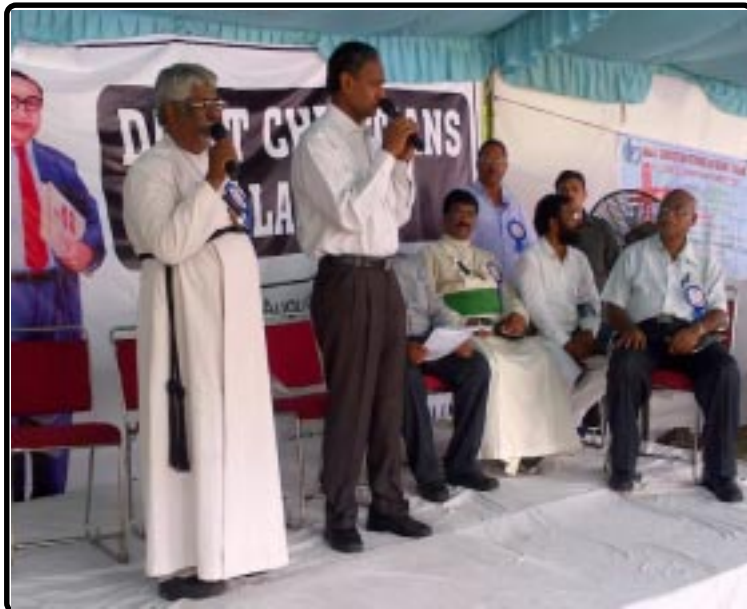
ડો.ઉદીતરાજ જંતરમંતર -દિલ્હી ખાતે દલિત ખ્રિસ્તીઓની અનામતના મુદ્દે યોજાયેલ રેલીના કાર્યક્રમમાં સંબોધિત કરી રહ્યા છે.

જો કે આંદામાન સત્તાવાળાઓએ મડ વલકેનો અને ગુફાઓની સાઈટ બંધ કરવાનો નવૈયો ભણ્યો હતો. અને સુપ્રીમ કોર્ટને અપીલ કરી હતી કે તાજેતરમાં થયેલા હુકમમાંથી આ બાબતને કાઢી નાંખવામાં આવે. આંદામાન સત્તાવાળાઓ સુપ્રીમ કોર્ટમાં નવી અરજી કરવાના છે જેમાં આઠ સપ્તાહ માટે હુકમ મુલવતી રાખવાની બાબત છે. જેથી તેઓ નવો બફર ઝોનનો પ્લાન મુકી શકે. જેથી તેમાં વલકેનો અને ગુફાઓની બાદબાકી કરી શકાય. સુપ્રીમ કોર્ટ દ્વારા અપાયેલ હુકમમાં એટીઆર ખુલ્લો રાખવાની અને ત્યાથી પસાર થવાની જે પરવાનગી આપી તે રદ કરવાની તક ચુકાઈ ગઈ છે. પરંતુ વલકેનો અને ગુફાઓ બાબતે અપાયેલ મનાઈ પુરતી છે. જેથી ટુર ઓપરેટર્સ દ્વારા હ્યુમન સફારીનો જે લાભ લેવાની ગણતરી હતી તે પર રોક લાગી છે. તેવું સર્વાઈવલ ઇન્ટરનેશનલના ડીરેક્ટર સ્ટીફન કોરીએ જણાવ્યું હતું. તેમણે વધુમાં જણાવ્યું હતું કે જો મડ વલકેનો અને લાઈમસ્ટોનની ગુફાઓ પ્રવાસીઓ માટે ખુલ્લી રહેશે તો હજારો પ્રવાસીઓ રોજ જશે અને જવારાને જે રક્ષણ આપવા પ્રયત્ન કરવામાં આવ્યો છે તેનો ભંગ થશે. જેથી આંદામાનના સત્તાવાળાઓએ પોતાને સાબિત કરવું પડશે કે તેઓ હુકમને તરફેણમાં છે.