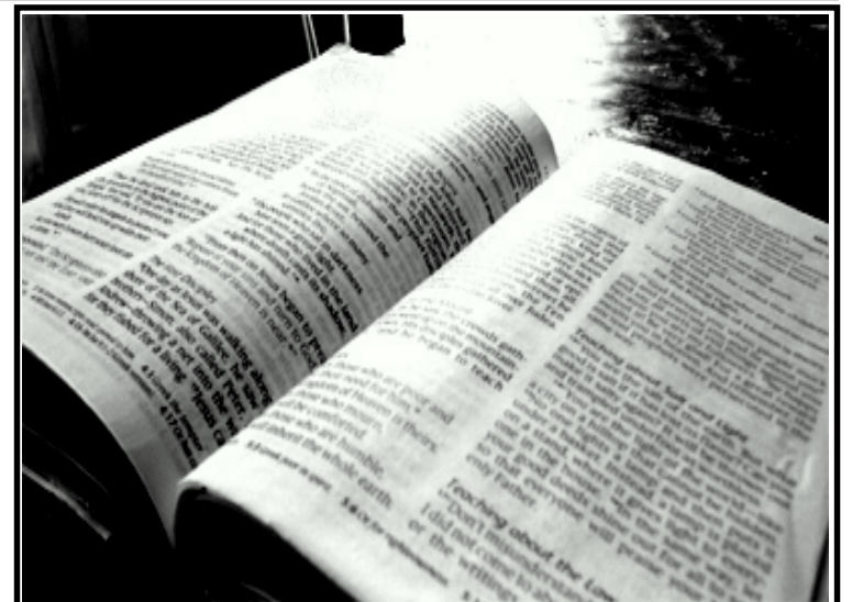
જુનામાં જુની માર્કની સુવાર્તા મળી આવી તેની તસવીર