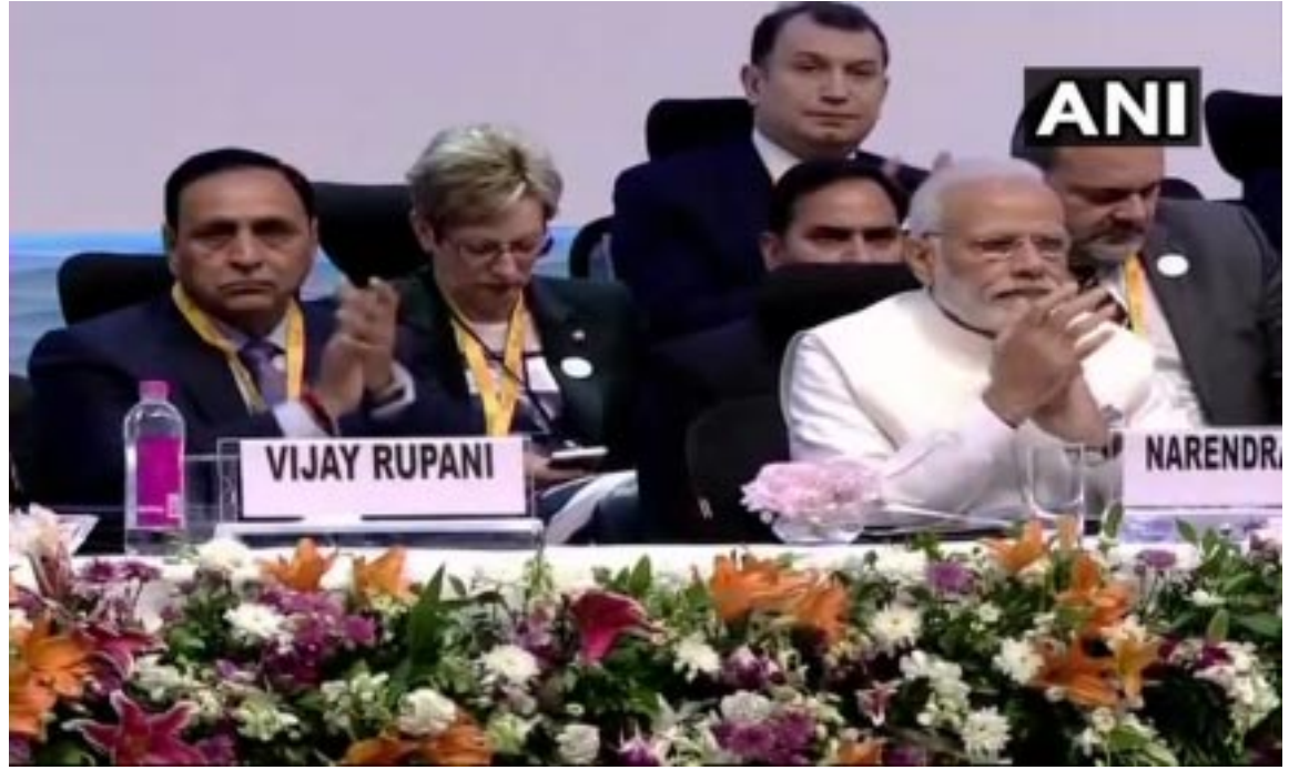
ગાંધીનગર ખાતે યોજાયેલી વાઈબ્રન્ટ સમીટના ઉદ્ઘાટન પ્રસંગે વડાપ્રધાન શ્રી નરેન્દ્રભાઈ મોદી અને મુખ્યમંત્રી વિજયભાઈ રુપાણી નજરે પડે છે.

આપની કોષ્ટપલ પ્રકારની જાહેર ખબરો સંપૂર્ણ વિગત સાથે મોકલી આપી, વિશાળ વાચક વર્ગ સુધી પહોંચાડો. જાહેરખબર દર મંગળવારે કાર્યાલય પર પહોંચાડવી સંપર્ક : ૯૮૨૫૧ ૬૯૩૮૬, ૦૭૯-૬૫૨૧૪૭૫૬