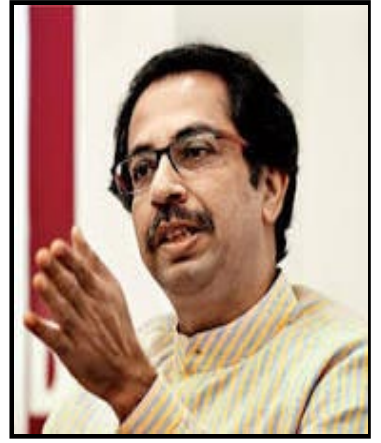
વડાપ્રધાનના ભાષણોમાંથી વિકાસનો મુદ્દો જ ગુમ થઈ ગયો છે.

સંપાદકીયમાં લખાયું હતું, ભાજપ સ્પોન્સર્ડ ચુંટણી પંચમાં ઈવીએમ કૌભાંડની ફરિયાદ કરવી વ્યર્થ છે. શિવસેનાએ કહ્યું હતું કે ગુજરાત ચુંટણી પ્રચાર અભિયાન ચર્ચિત વિકાસ એજન્ડા પર કેન્દ્રીત હોવું જોઈતું હતું પણ ગુજરાતમાં