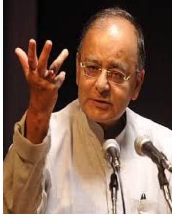
દેશની સેવાને પ્રાથમિકતા આપે છે. દેશની પ્રતિષ્ઠાને કોઈ નુકશાન થયું નથી.

દેશના અર્થતંત્ર માટે મહત્વના વળાંક સમાન હતો. નાણાંમંત્રીએ આ સાથે કહ્યું કે નોટબંધી એ તમામ સમસ્યાનો ઉકેલ નથી. પરંતુ તેણે એજન્ડા બદલ્યો છે. અને પગલાંથી લેશ-કેશ ઈકોનોમી તરફ દેશ આગળ વધ્યો છે. જેને કારણે વધુ સંખ્યામાં લોકો ટેકસની જાળમાં આવ્યા છે. અને તેને કારણે ટેરર ફંડીંગ પણ ઘટ્યું છે. નોટબંધીને કારણે માલુમ પડ્યું છે કે ૧૮ લાખ લોકો પાસે આવક કરતાં વધુ પ્રમાણમાં સંપત્તિ છે. કોગ્રેસે કાળા નાણાં સામે ક્યારે પગલાં લીધા નથી. નીતિમતાના મુદ્દે ભાજપ કોગ્રેસથી અલગ દષ્ટિકોણ ધરાવે છે. ભાજપ